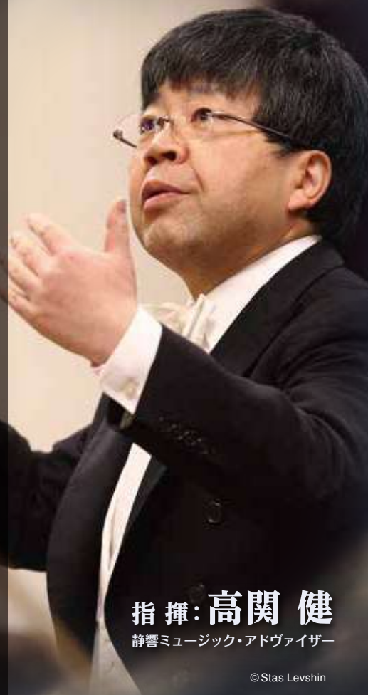
指揮: 高関 健 静響ミュージック・アドバイザー