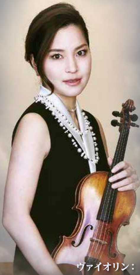
ヴァイオリン: 神尾 真由子